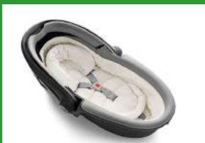
Автокресло «люлька» группы 0 для детей массой менее 10 кг

Детские удерживающие устройства подразделяют на 5 весовых групп: