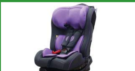
Автокресло группы II для детей массой 15-25 кг