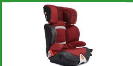
Автокресло группы III для детей массой 22-36 кг (возможно использование бустера)