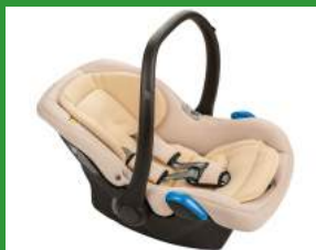
Автокресло группы 0+ для детей массой менее 13 кг