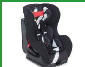
Автокресло группы I для детей массой 9-18 кг